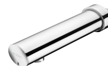
Erogazione a parete MODUS E