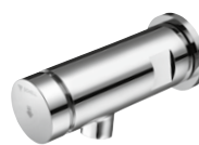
Erogazione a parete PETIT SC